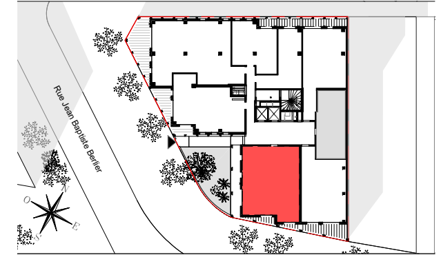
APPARTEMENT DE 4 PIECES n°1023 au 2ème étage